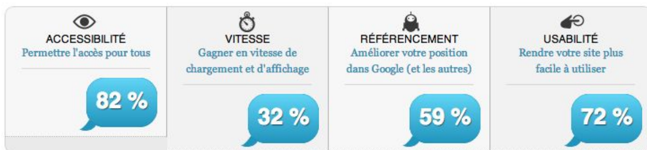
Résultats par rubriques, pour l'ensemble des 39 sites

La majorité des sites présente des résultats corrects en accessibilité (82%) et en utilisabilité (72%). Cependant, rappelons qu'une excellente note dans ces rubriques ne signifie pas que ces sites sont parfaitement accessibles pour les personnes handicapées ou que leur utilisabilité est irréprochable. Cela signifie simplement qu'un premier pas dans ces domaines a été effectué.